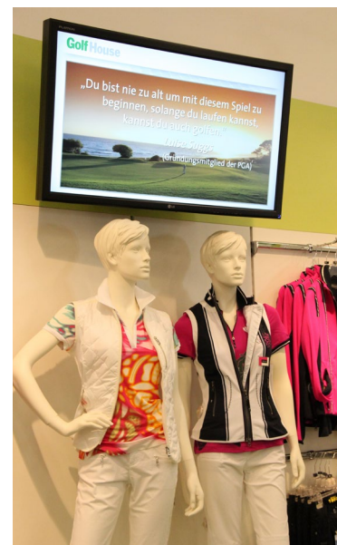
Werbedisplay im Produktbereich der Golf-House-Filiale in Hamburg Hammerbrook.

Die Filialen erhielten hochwertige Monitore der Marke LG, die in den Produktbereichen der Filialen prominent platziert wurden. Dort werben sie für die aktuellen Golf-House-Angebote und sorgen für Golfplatzstimmung. Die Filialen in Mannheim, Stuttgart und Bielefeld erhielten außerdem eine Videowall im Kassenbereich, bestehend aus jeweils vier 47-Zoll-Displays. Die Videowalls dienen dazu, den Kauf des Kunden zu bestätigen und positiv abzuschließen. Dazu werden z.B. Golfplatzimpressionen angezeigt, um beim Kunden Vorfreude auszulösen.