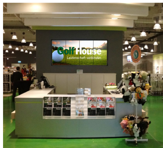
Die Displays an der Kasse der Golf-House-Filialen in Hamburg Hammerbrook (links) und in Mannheim (rechts).