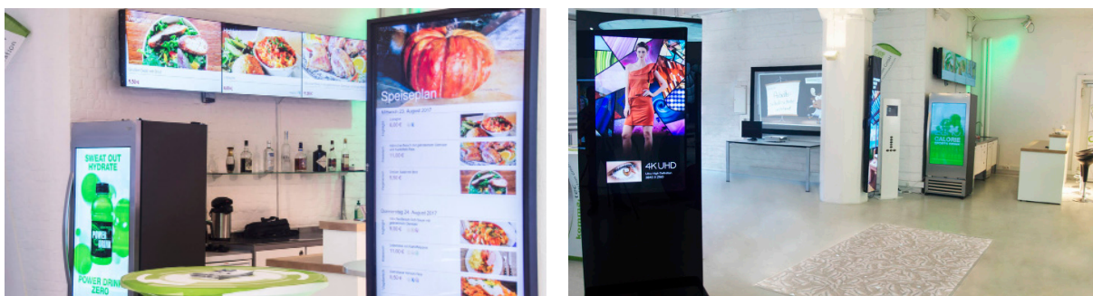
Hardware, Software, Templates: Wie Digital Signage z.B. im Restaurant oder Einzelhandel eingesetzt wird, erfahren Besucher live vor Ort.

NEC stattete das Digital Signage Innovation Center weiterhin mit folgender Hardware aus: